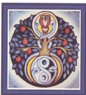
Baum der Erkenntnis: Collage von Heidi Montag

So denken bestimmt viele von uns. In den USA gab es zahlreiche Nachrufe. Ihr findet diese auf » http://marydaly.org/Links.aspx . Bis auf den "Standard" in Wien kenne ich keinen Nachruf in einer deutschsprachigen Tages- oder Wochenzeitung, obwohl ich bei der TAZ, FR, SZ, beim Kölner Stadt-Anzeiger sowie dem SPIEGEL und DER ZEIT insistiert habe.