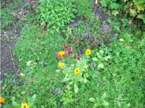
Frühling im Labyrinth Euskirchen

Tabakrauch macht Wohnungsgegenstände zu Gefahrgütern. Aus Nikotin und Luftschadstoffen entstehen im Haus krebserregende Nitrosamine, die sich auf Teppichen und Tapeten ablagern. Quelle: PNAS. Gefunden bei Leonardo am 9. 2. 2010